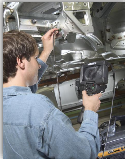
Camera (5.0, 6.1 mm and 8.4 mm diameter Probes)